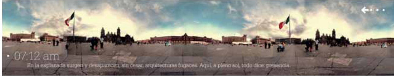
1140 minutos en el ombligo de la luna, 2005. CONACULTA, México, D.F. Editor: Conrado Tostado. Fotos: Bernardo Hernández y León Muñoz.

El Zócalo es el ombligo de la luna y, como todo ombligo, tiene su pelusa. Siete siglos de valores religiosos y políticos atribuidos a la plaza central del imaginario nacional no han impedido las expresiones más sutiles y efímeras de la vida cotidiana.