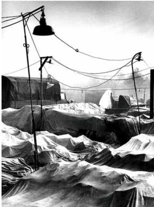
Markt, frühmorgens. Robert Häusser, 1953.