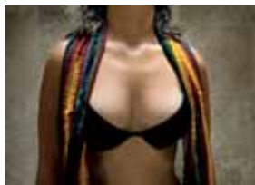
Sin título. Pablo Ortiz Monasterio