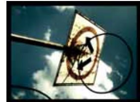
Tecnología rascuache, 2008. Ramón Orozco. Fotografías.