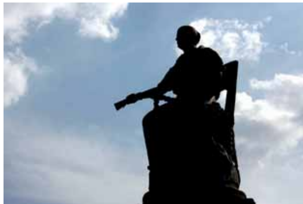
ESTATUA DE LA CORREGIDORA EN LA PLAZA DE SANTO DOMINGO