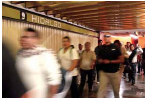
UNA DE LAS DOS ESTACIONES DEL METRO CON NOMBRES DE INSURGENTES