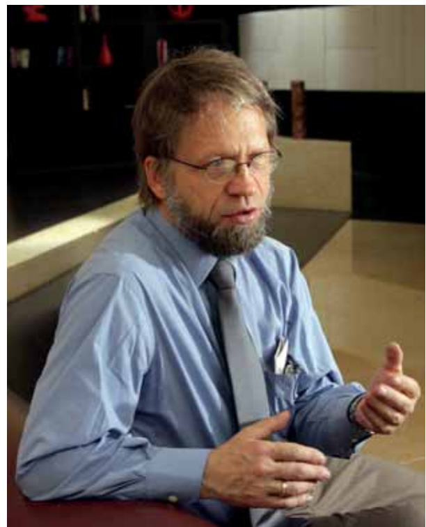
“NO SOY UN BLANDO, SINO UN DURO LIMPIO”, HA DICHO MOCKUS DE SÍ MISMO

Para lograr sus objetivos tuvieron que ser muy creativos... (Una de sus medidas más memorables fue colocar en los cruceros a mimos que desplegaban un letrero con la palabra “¡Incorrecto!” cuando los peatones o los automovilistas cometían una falta).