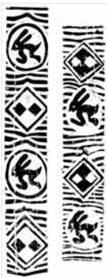
Nocturno al conejo de la luna, 2009. Betsabeé Romero. Serigrafía sobre papel ciclorama. Cinco llantas de camión grabadas, basado en un sello cilíndrico prehispánico de la colección Museo Amparo.

La traza de la ciudad es muchas cosas. Es mapa, es ruta, es referencia, es eje. También es historia. Capas de tiempo unas encima de otras que, como marcas en un viejo rostro, van modificando la expresión de la urbe. Historiadores, arqueólogos y restauradores nos señalan estas marcas: a veces contundentes como los murales de la caja de agua de Tlatelolco; otras veces más sutiles como los nombres de Río Mixcoac o Canal de Miramontes; o casi imperceptibles, como los ahuehuetes, viejos guardianes del agua. Señales que nos invitan a mirar lo que por estar tan cerca de nosotros, ya no vemos, pero que nos ayudaría a reconocernos con nuestro entorno.