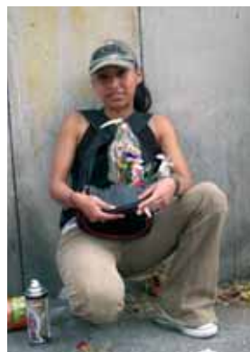
Exvotos, 2008. Citámbulos. Impresión digital sobre aluminio.

Condenables, absurdos o hasta diabólicos es como solemos juzgar los rituales ajenos. En parte porque los desconocemos, pero también porque los mexicanos solemos pensar que debemos hacer, sentir y creer lo mismo. Ciegos ante nuestras múltiples herencias, hemos combatido cultos según la época: politeísmo prehispánico, catolicismo durante la Cristiada, protestantismo indígena, y a últimas fechas, el culto a la Santa Muerte, sin darnos cuenta de que con ello negamos a una parte importante de la población. ¿Cómo concebimos, entonces, sin estar obligados a creer en lo mismo y sin ser excluyentes?