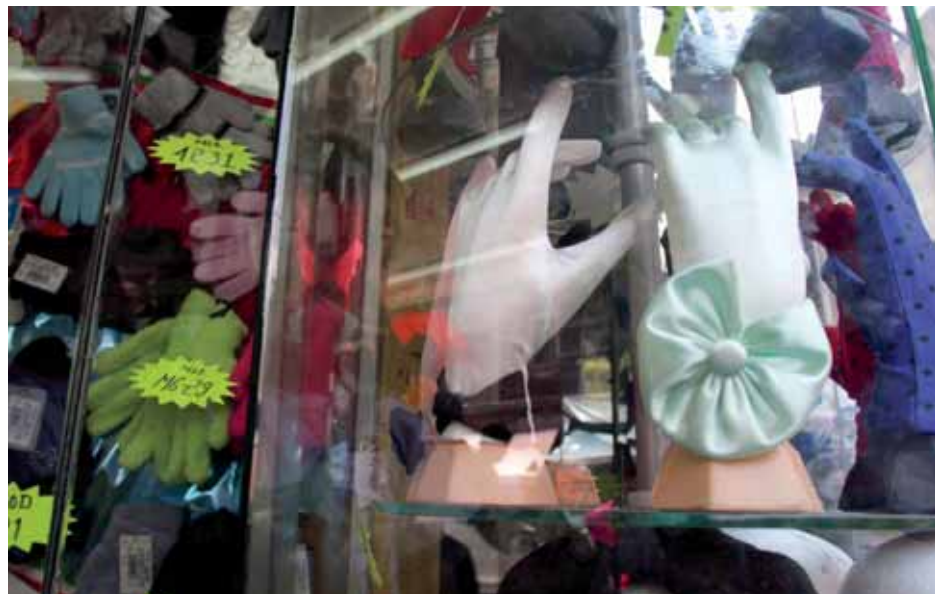
LOS MATERIALES VAN DEL ENCAJE A LA LICRA Y AL ACRILÁN, A LA PIEL, EL ALGODÓN Y CHENILLE

Soledad 3, esquina Correo Mayor. L-S 9:30-18hrs. Tel.: 5522 5421.