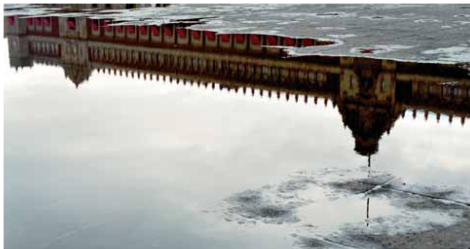
Zócalo, 2009. Ulrike Stehlik.

No hay que olvidar que el Centro Histórico era, hasta mediados del siglo XIX, toda la Ciudad de México. Lo demás estaba conformado por pueblos y barrios dispersos en islas, llanos y lomas. Durante el transcurso de siete siglos, se han plasmado en los edificios, calles y plazas del Centro diversas concepciones de lo que debía ser una ciudad. Esto resultó en un área de aproximadamente 10 km 2 donde se concentra la mayor densidad de monumentos históricos de América Latina. Pero además de la difícil tarea de conservar la arquitectura, se impone la obligación de trascender el arreglo de las fachadas y reconstituir su vida interna así como sus usos cotidianos.