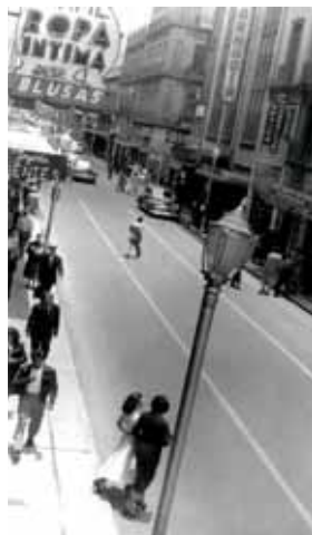
Calles de Isabel La Católica, Palma, Maderoy Justo Sierra. Anónima.