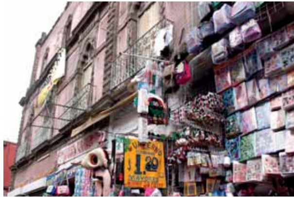
PREDIO DONDE NACIÓ JOSEFA ORTIZ