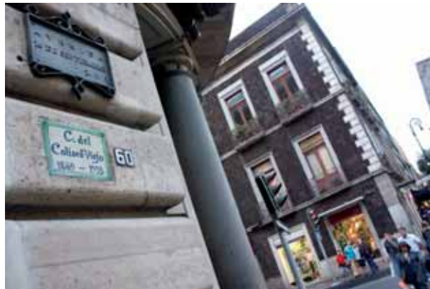
16 DE SEPTIEMBRE, UNA DE LAS PRINCIPALES VÍAS DE ACCESO AL CENTRO HISTÓRICO