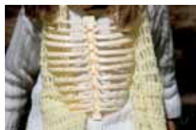
Sin título. Marcelo Brodsky

Cada dos años el Centro lanza la convocatoria y cualquier persona o institución puede inscribir trabajos y proponer exposiciones o sedes. “El Centro supervisa la calidad de las propuestas, entra en contacto con los fotógrafos y busca espacios cuando es necesario. Cada vez hay mayor apertura y participación tanto de la comunidad como de las instituciones”, añadió Castellanos.