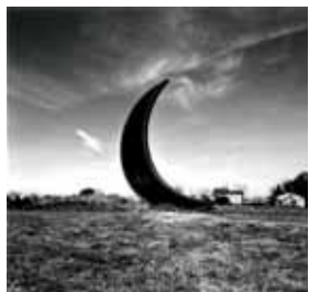
Sin título. Graciela Iturbide.